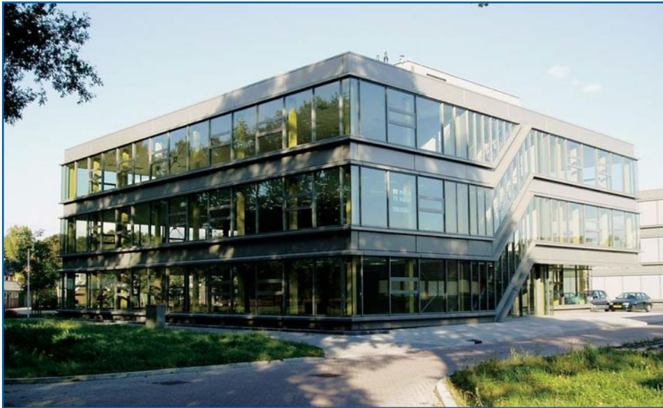
Kantoorgebouw in Winterswijk.

nen het afgesproken budget! – moet aftasten en oprekken. ‘Dat is de ultieme uitdaging. Roeien met de riemen die je hebt en dan proberen zo ver mogelijk te komen. Net zo lang ploeteren en doorgaan tot het pand de opdrachtgever als gegoten zit, zoals een favoriete jas waar je geen afstand van wilt doen.’